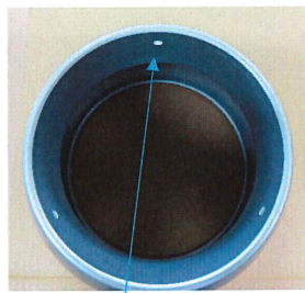
後付けの場合、穴が開いて いないため3カ所に穴をあける