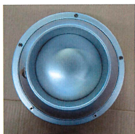
PK一般品 ガイド用の穴は開いて おりません

本空調用吹出口は、球体を回転させることにより温風、及び冷風を自由な方向へ送り、調整ノブを操作することで風量調整が可能な製品です。また、エアーガイドによってパンカールーバーの球体の外周部に吹き出され球体周囲の空気を押し出し、結露の発生を大幅に低減します。エアーガイドは熱を伝えにくい樹脂（難燃性）を採用しております。