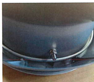
ワッシャとナットを内側から入れたボルトに 止める。