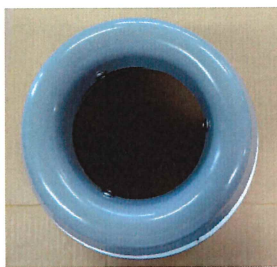
PK-K結露対応品 ガイドは3カ所のボルトで 止めてあります